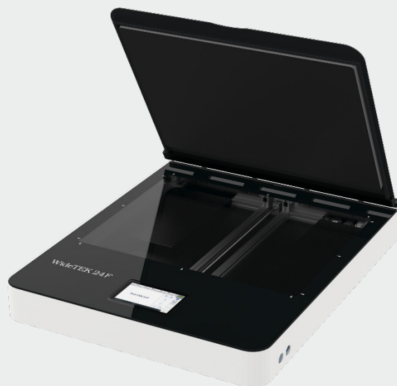
Стеклянная пластина с защитой от повреждений позволяет сканировать крупные оригиналы